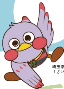
埼玉県マスコット 「さいたままっち」